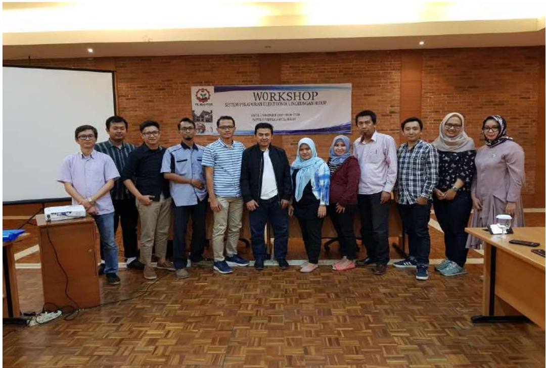
PHOTO PELATIHAN SIMPEL-FESTRONIK