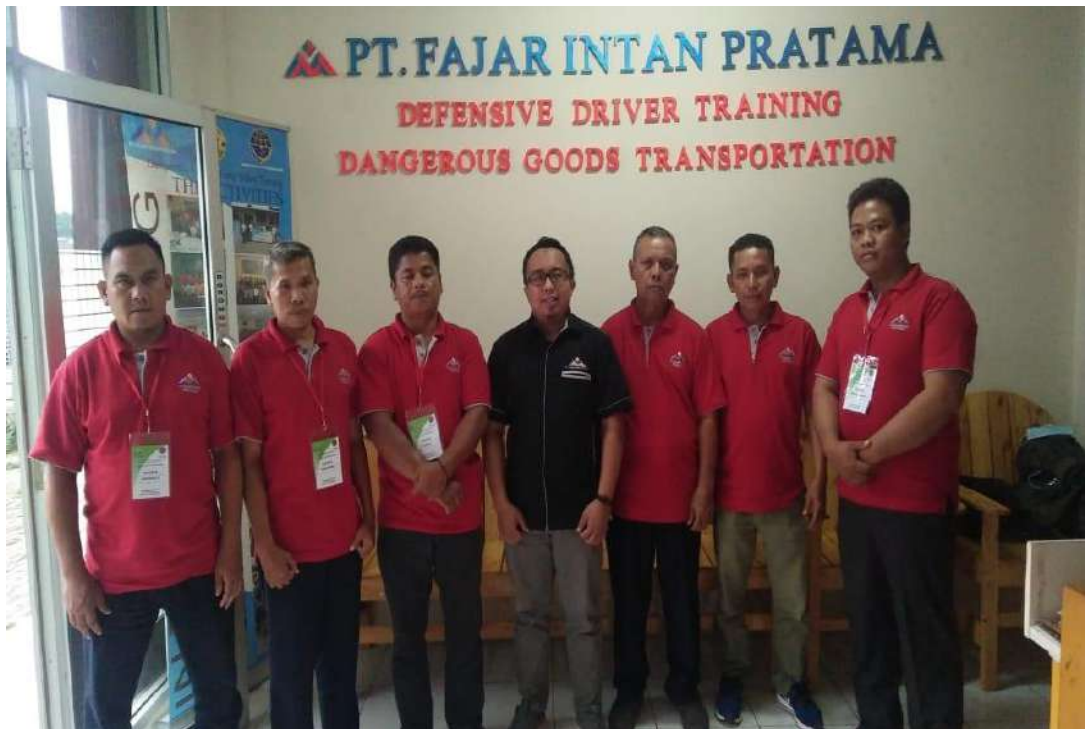
PHOTO PELATIHAN PENGEMUDI LB3